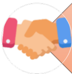
Ilustración 69 Clases de obligaciones- cuadro del autor.

La obligación de dar conlleva la transferencia del dominio de un derecho real; o de una cosa, mueble o inmueble; o su tradición; o la entrega de la mera tenencia o su uso; o la restitución a su dueño. Artículo 1.605 del C.C. “ La obligación de dar contiene la de entregar la cosa; y si ésta es una especie o cuerpo cierto, contiene, además, la de conservarla hasta la entrega, so pena de pagar los perjuicios al acreedor que no se ha constituido en mora de recibir. ”.