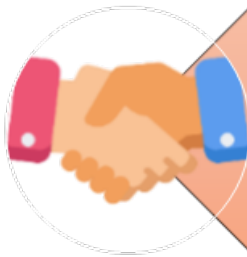
Ilustración 69 Clases de obligaciones- cuadro del autor.

La obligación de dar conlleva la transferencia del dominio de un derecho real; o de una cosa, mueble o inmueble; o su tradición; o la entrega de la mera tenencia o su uso; o la restitución a su dueño. Artículo 1.605 del C.C. “La obligación de dar contiene la de entregar la cosa; y si ésta es una especie o cuerpo cierto, contiene, además, la de conservarla hasta la entrega, so pena de pagar los perjuicios al acreedor que no se ha constituido en mora de recibir.”.