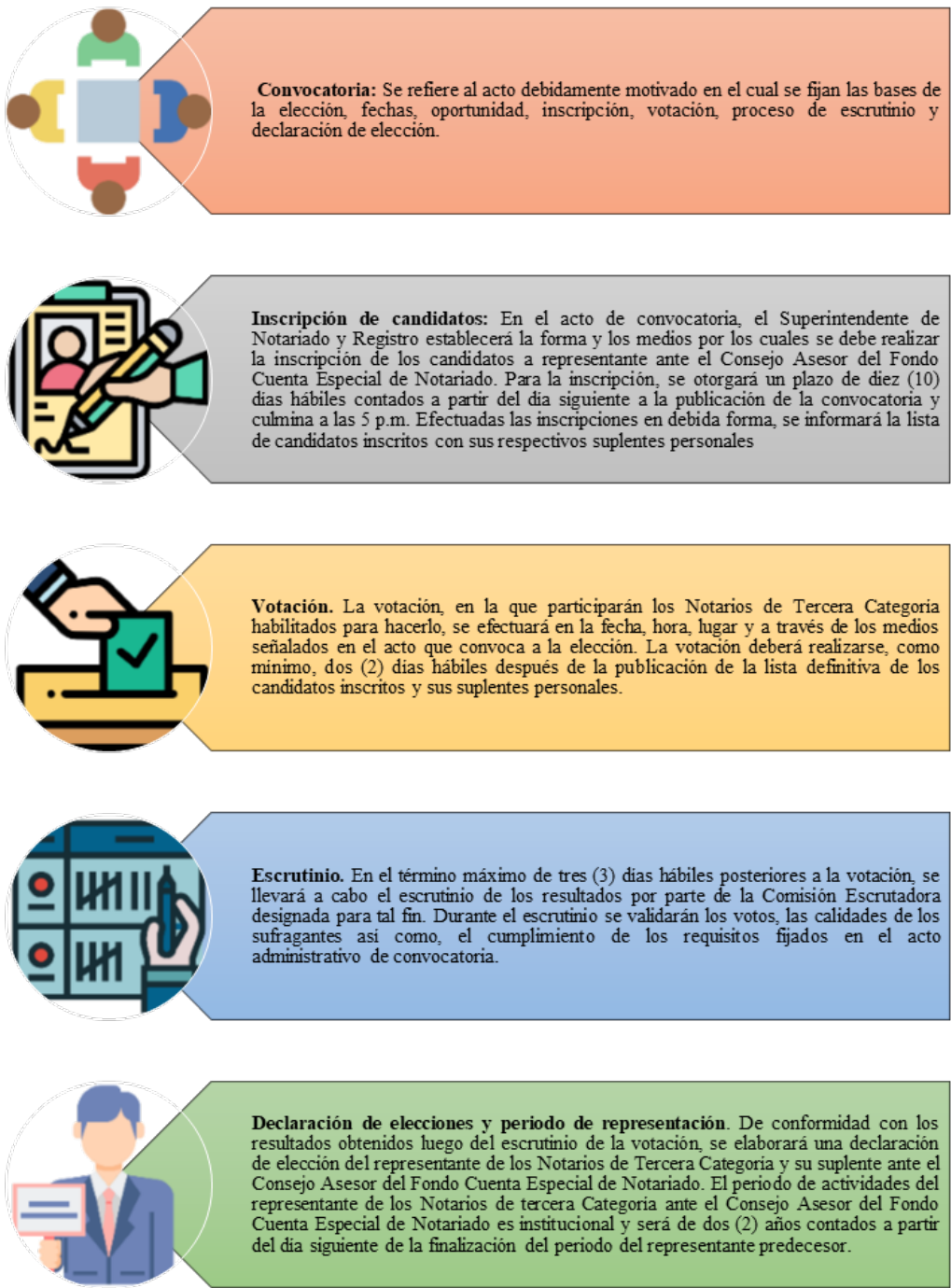
Ilustración 73 Procedimiento para elección del representante de los Notarios y su suplente ante el Consejo Asesor del Fondo Cuenta Especial de Notariado- cuadro del autor.